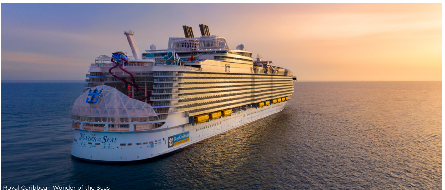
Royal Caribbean Wonder of the Seas