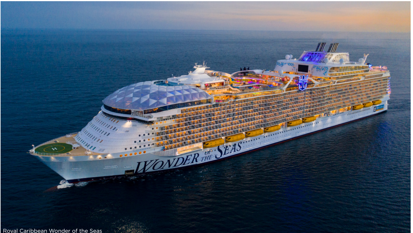
Royal Caribbean Wonder of the Seas

Wonder of the Seas ima osam "komšiluka" - Central Park, Boardwalk, Pool and Sports Zone, Entertainment Place, Royal Promenade, Vitality Spa and Fitness, Youth Zone i Suite Class Neighborhood . Central Park će biti prvi pravi park na moru sa oko 20.000 biljaka, specijalizovanim restoranima i luksuznim prodavnicama. Gosti tokom dana mogu uživati u ovoj otvorenoj oazi, a u večernjim satima u živoj muzici pod zvezdama. Boardwalk se nalazi na otvorenom prostoru u zadnjem dijelu broda sa jedinstvenim sadržajima: karusel, stijena za penjanje i AquaTheater. U komšiluku bazeni i sport se nalaze FlowRider surf simulator, bazeni i đakuziji, zip line i visoki tobogan Ultimate Abyss. U ovom dijelu se nalaze i tereni za košarku, odbojku i mini golf. U Royal Theatre se u večernjim satima održavaju spektakularne predstave u stilu Broadway-a i Las Vegasa. Ovde se nalazi i klizalište i Spotlight Karaoke. U srcu broda se smjestila Royal Promenade sa prodavnicama, restoranima i zabavnim sadržajima. Ovaj brod nudi vrhunski doživljaj krstarenja uz sjajnu uslugu i nezaboravne sadržaje.